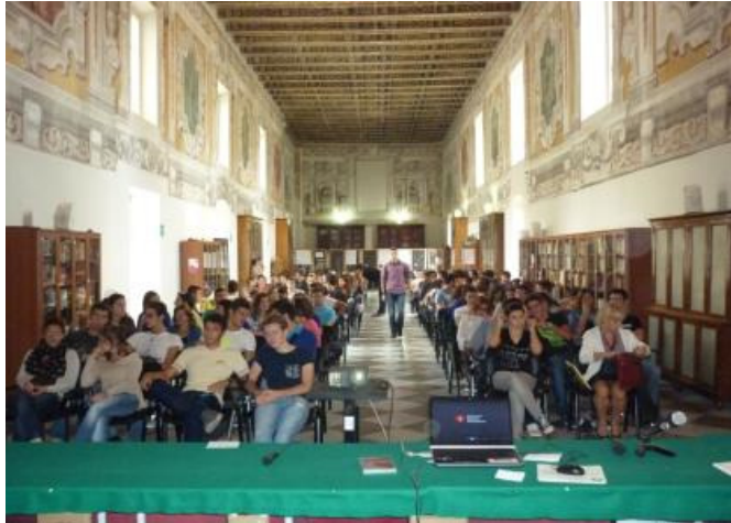
Liceo Scientifico Benedetto Croce, Palermo “Impara a scuola a salvare una vita”