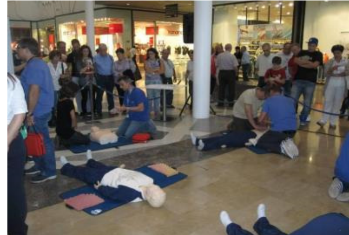
Centro commerciale Forum, Palermo “Il primo soccorso: First Aid Can Save Your Life”